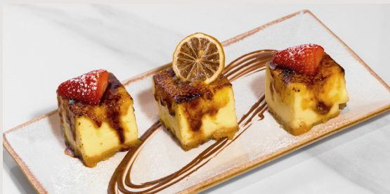
是日精選蛋糕 Daily Cake $48