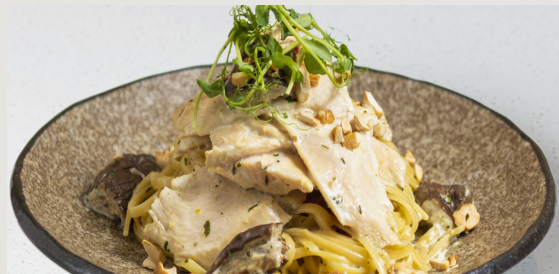
慢煮雞胸 · 青咖哩汁 · 扁意粉 Sous-vide Chicken Breast · Green Curry Sauce · Linguine $138