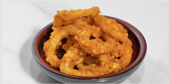
唐揚魷魚圈 · 香料蛋黃醬 Karaage Squid Ring · Cajun Mayonnaise $88