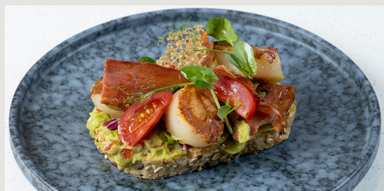
北海道帶子 · 煙肉 · 牛油果醬 · 酸種吐司 Seared Hokkaido Scallop · Bacon · Guacamole · Sourdough Toast $148