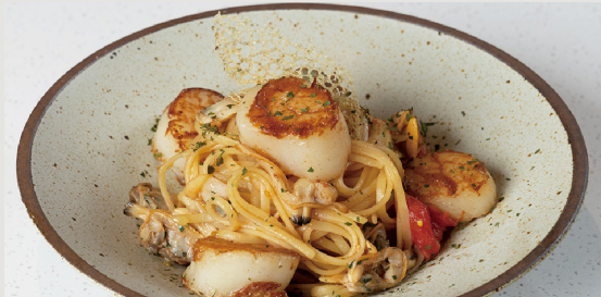
北海道帶子 · 香蒜蜆汁 · 扁意粉 Hokkaido Scallop · Garlic Clam Sauce · Linguine $168