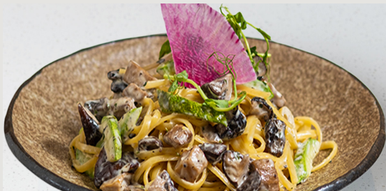
雜錦蘑菇 · 香草牛油汁 · 扁意粉 Mixed Mushrooms · Butter Herbs Sauce · Linguine $118