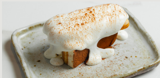
自家製提拉米蘇 Homemade Tiramisu $48