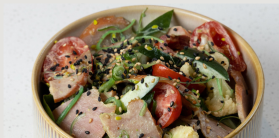
煙燻鴨胸 · 椰菜花沙律 · 芥末籽沙律汁 Smoked Duck Breast · Cauliflower Salad · Grain Mustard Dressing $88