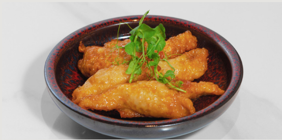
雞皮餃子 · 菠蘿照燒汁 Chicken Skin Dumplings · Pineapple Teriyaki Sauce $68