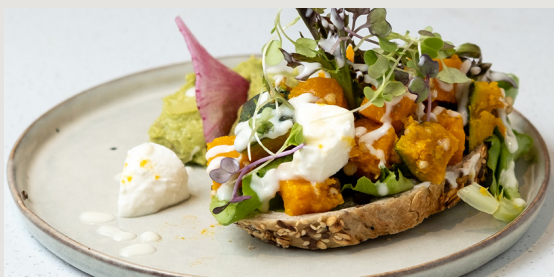
烤南瓜 · 牛油果醬 · 水牛芝士 · 蜜糖乳酪 · 酸種吐司 Roasted Pumpkin · Guacamole · Mozzarella Cheese · Honey Yogurt · Sourdough Toast $108