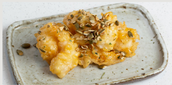
石蝦天婦羅 · 香蒜蛋黃醬 Tempura Rock Shrimp · Garlic Mayonnaise $108