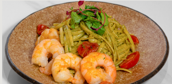
大蝦 · 香茜青醬 · 扁意粉 Shrimp · Coriander Pesto · Linguine $158