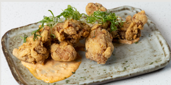
SENSU 脆炸雞件 · 泡菜蛋黃醬 SENSU Deep-fried Chicken · Kimchi Mayonnaise $88