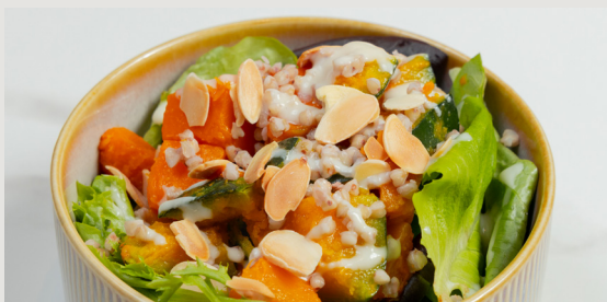
日本南瓜 · 藜麥沙律 · 杏仁 · 藍莓乳酪 Japanese Pumpkin · Quinoa Salad · Almonds · Blueberry Yogurt $78