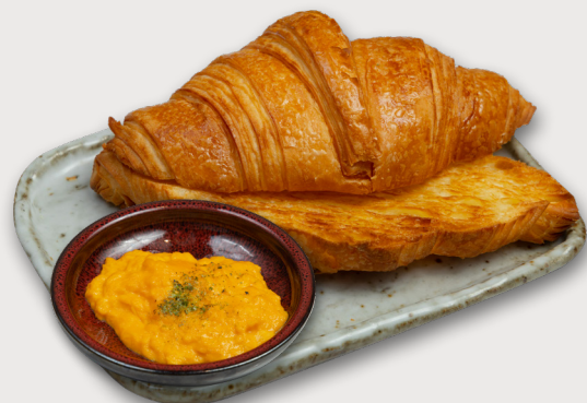
牛角包 · 滑蛋 Croissant · Scrambled Eggs