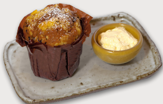
自家製藍莓鬆餅 · 忌廉芝士 Blueberry Muffin · Cream Cheese