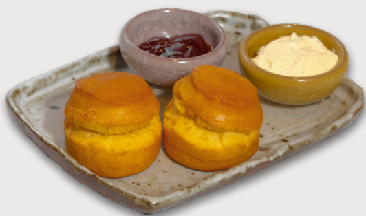
司康 · 果醬 · 忌廉芝士 Scone · Jam · Cream Cheese