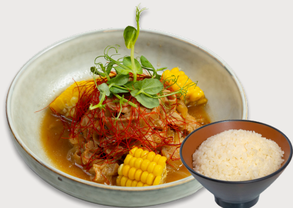
豚肉生薑燒 · 越光米飯