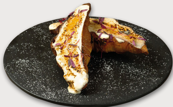
火炙焦糖忌廉芝士 · 牛角包吐司 Caramel Cream Cheese · Croissant