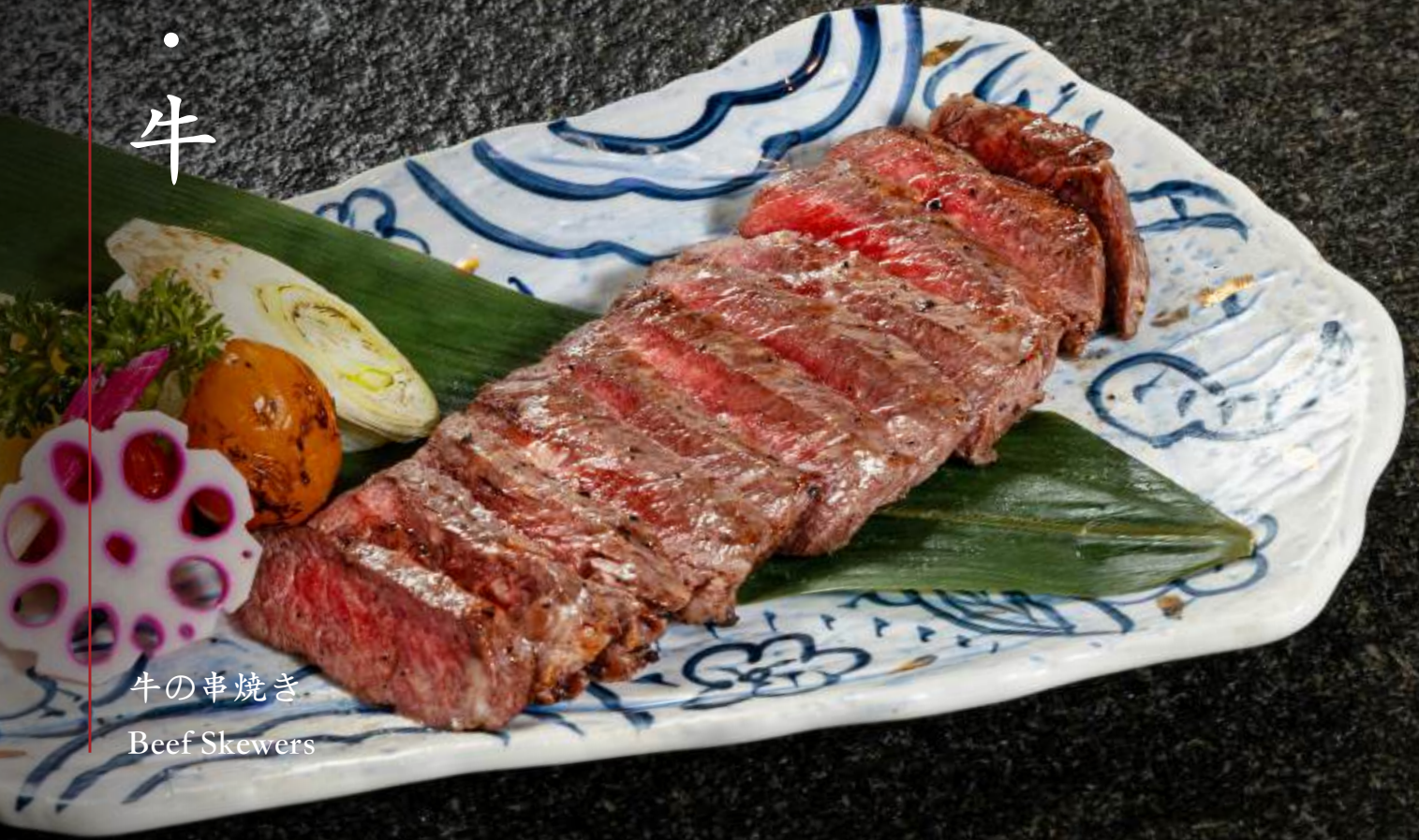
牛の串焼き Beef Skewers